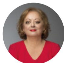
Cristina García Rodero

1993 - Primer Premio Word Press Photo en la categoría de Arte. 1996 - Premio Nacional de Fotografía del Ministerio de Cultura en Madrid. 2005 - Medalla de Oro al Mérito en las Bellas Artes. 2005 - Entró a formar parte de la agencia fotoperiodística Magnum. 2018 - Primera mujer doctor honoris causa por la Universidad de Castilla-La Mancha.